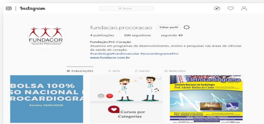
Imagem 2 - Perfil https://www.instagram.com/fundacao.procoracao/

que a conta alcançou 100 (cem) adeptos (Imagem 2).